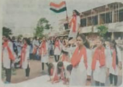
रेलवे स्टेशन, जुद्ध भूम स्थानक, नवीन बस स्थानक, पंचायत समिती परिसर आदी परिसरातील जवळपास एक किंमेटल

अर्जुनी मोरगाव, (वा.) येथील शिवप्रसाद सदानंद जाधवसाल महाविद्यालयस्थीत राष्ट्रीय सेवा योजनेच्या विभागाच्यावतीने 19 ऑक्टोबर रोजी प्लास्टिक कचरा संकलन व निर्मूलन अभियान राबविण्यात आला. दरम्यान विद्यार्थ्यांनी केलील्या 'जग बदलले तुम्हीही बदला' घोषवाक्याने अर्जुनी नगरी दुमदुमली होती. राष्ट्रीय सेवा योजनेच्या विद्यार्थ्यांनी प्लास्टिक कचरा जमा करून त्यात भारतीयराष्ट्रध्वज