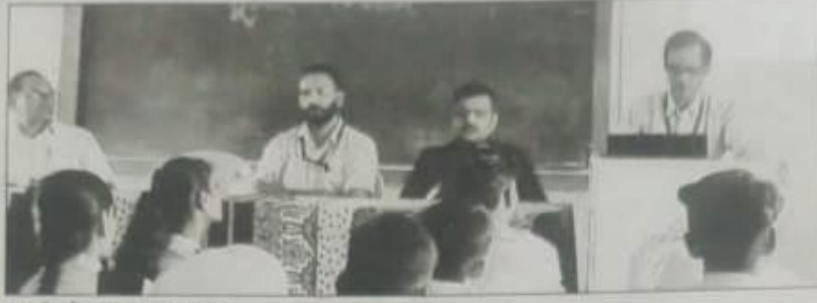
मार्गदर्शन करताना मान्यवर