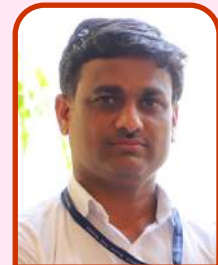
डॉ. सतीश चव्हाण